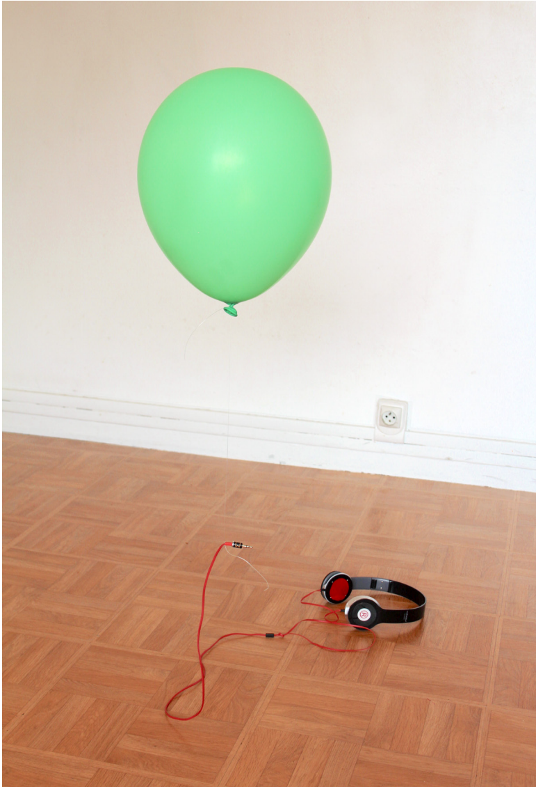
Where's the Cloud ? installation in-situ, ballon, hélium, fil et casque audio