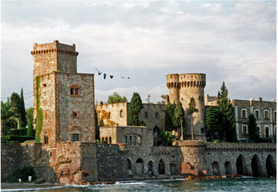
Jour de lessive Château de la Napoule - linge, fil, pincés édition de cartes postales - 2001